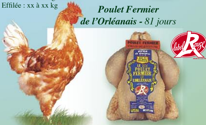
Poulet Fermier de l'Orléanais - 81 jours

P.A.C : 1,3 à 1,7 kg Effilée : 1,6 à 2 kg