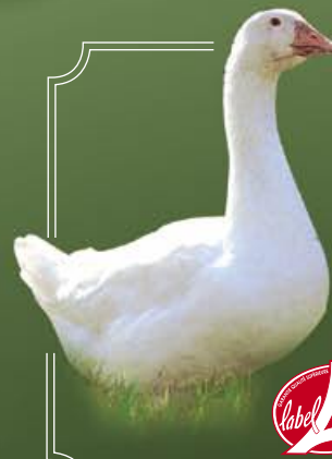
L'Oie Fermière "L'Angevine"

P.A.C : 2,8 à 3,4 kg Éfilée : 3,5 à 4 kg