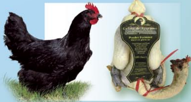
Géline de Touraine