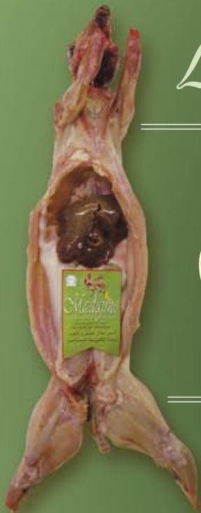
Lapin P.A.C : xx à xx kg Éfilée : xx à xx kg