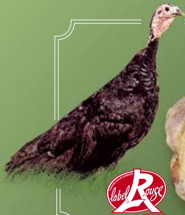
Dinde Fermière de l'Orléanais

P.A.C : 1,9 à 2,1 kg Éfilée : 2,4 à 2,6 kg