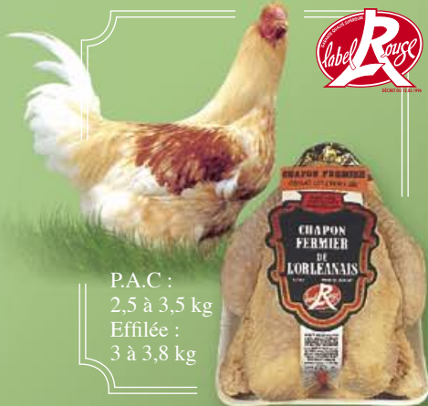
Chapon Fermier de l'Orléanais

P.A.C : 2,5 à 3,5 kg Éfilée : 3 à 3,8 kg