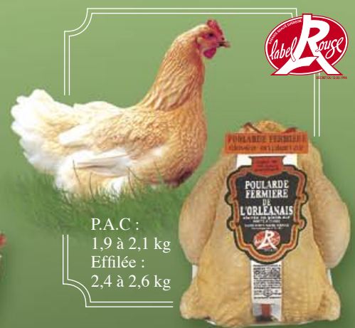
Poularde Fermière de l'Orléanais

P.A.C : 1,9 à 2,1 kg Éfilée : 2,4 à 2,6 kg